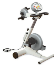
Arme und Beine

Mit dem MOTOmed viva2 holen Sie sich professionelle Bewegungstherapie nach Hause. Dient zum Aufbau und Erhaltung Ihrer Muskulatur.